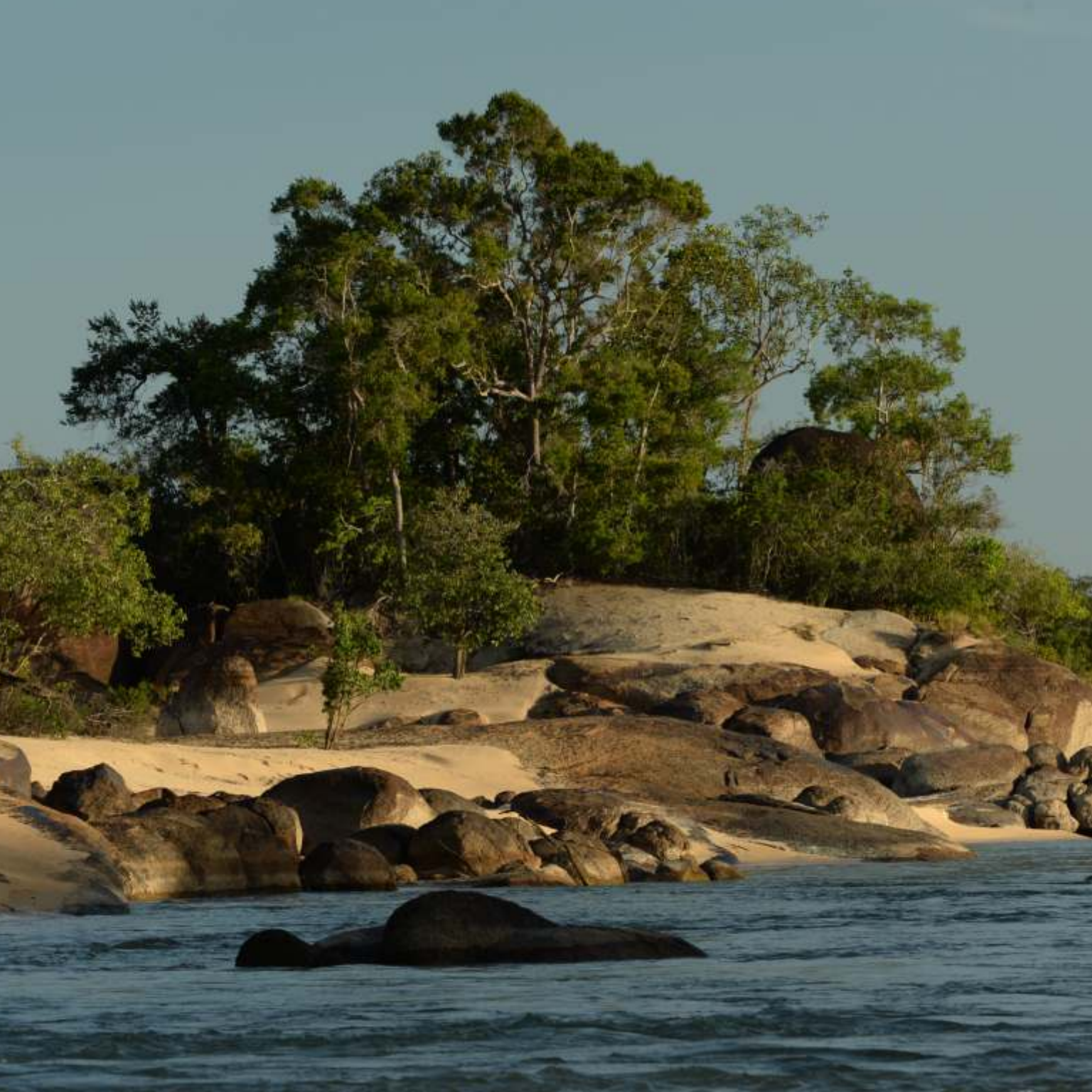
Parque Nacional Natural El Tuparro