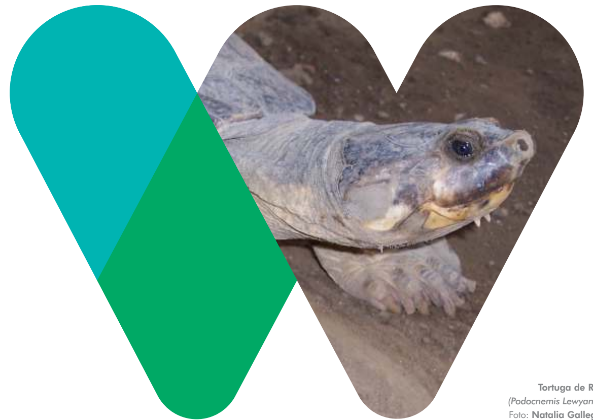
Tortuga de Río (Podocnemis Lewyana)

Boletín divulgativo de WCS Colombia - Julio de 2016 - No. 6